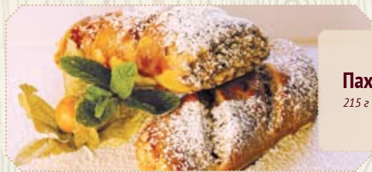
Пахлава 215 г | 290 р.