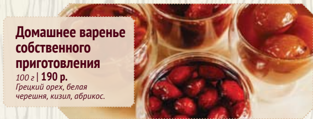
Домашнее варенье собственного приготовления 100 г | 190 р. Грецкий орех, белая черешня, кизил, абрикос.

Доставка заказов от 1000 рублей бесплатно. Доставка по северу города.