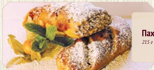
Пахлава 215 г | 290 р.