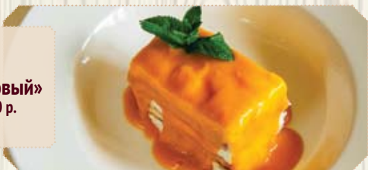
Торт «Манговый» 290 г | 390 р.