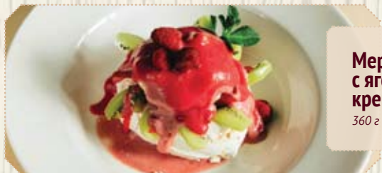
Меренга с ягодным кремом 360 г | 350 р.

Ассорти лучших десертов от кондитеров Мацони. Блюдо на 2-3 человек.